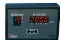
専用小型震度表示機 (オプション)